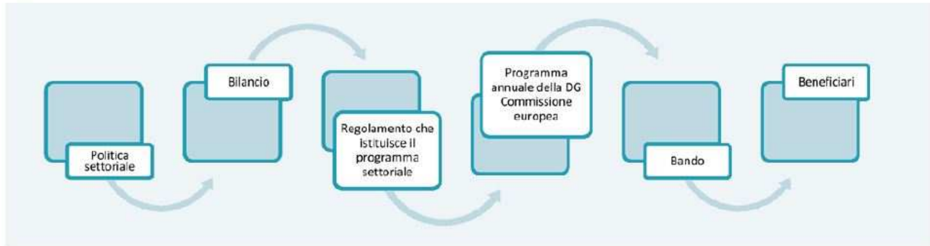
Figura 2 - GOVERNANCE DEI PROGRAMMI STRUTTURALI