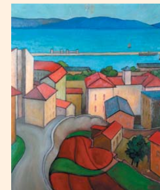
Golfo del Quarnaro di Tassilo de Guytjo