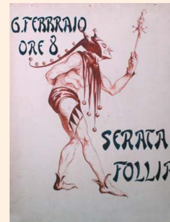
Carnevale Fiumano di Riccardo Gigante