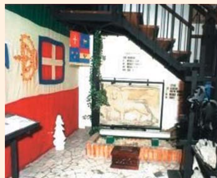
Sacario delle bandiere