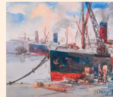
Fiume, porto di Marcello Ostrogovich