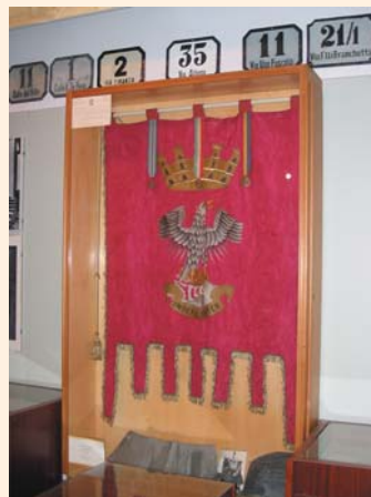
Gonfalone del Comune di Fiume (1924-1945)