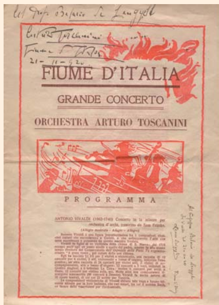
Orchestra Arturo Toscanini a Fiume (1920)